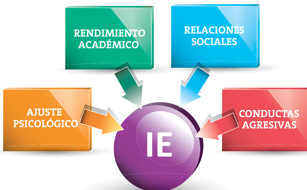
Figura 2. EFECTOS COMPROBADOS DE LA IE EN ADOLESCENTES

Los adolescentes con baja IE poseen peores habilidades interpersonales y sociales, lo que puede generar el desarrollo de conductas de riesgo. La investigación indica que los adolescentes con una menor IE tienen más posibilidades de consumir drogas como tabaco y alcohol, o drogas ilegales como cannabis o cocaína. Los adolescentes con una mayor habilidad para manejar sus emociones son capaces de afrontarlas de forma adaptativa en su vida cotidiana, teniendo como consecuencia un mejor ajuste psicológico, una menor búsqueda de sensaciones y un menor consumo de drogas.