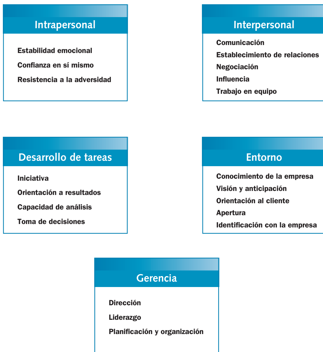
Figura 1.1. Modelo de competencias del compeTEA

Igualmente, está basada en un modelo de competencias (figura 1.1) con una amplia experiencia en el mundo aplicado; además, ha sido contrastado empíricamente y cuenta consiguientemente con un sólido respaldo. Por tanto, no se trata únicamente de una propuesta teórica en la que es posible basar los juicios competenciales derivados de su aplicación, sino de un punto de partida muy prometedor a partir de los resultados y las evaluaciones que se han podido analizar. No obstante es deseable que con el tiempo se vayan acumulando más evidencias a partir de su uso en múltiples contextos, para matizar, moldear o corroborar los hallazgos que se puedan obtener de un instrumento con las características del compeTEA.